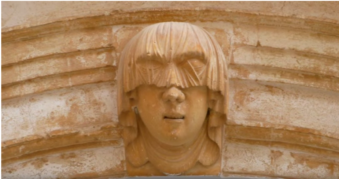
Palacio del Conde de Torresaura, Ciutadella de Menorca.